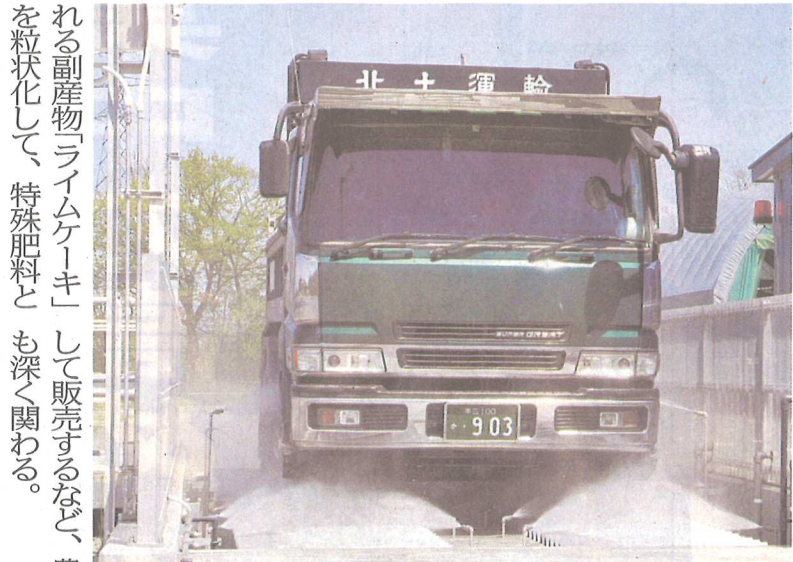
ジャガイモシストセンチュウ対策として開発された車両洗浄装置

れる副産物「ライムケーキ」して販売するなど、農業にを粒状化して、特殊肥料とも深く関わる。